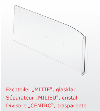
Fachteiler „MITTE“, glasklar Séparateur „MILIEU“, cristal Divisore „CENTRO“, trasparente