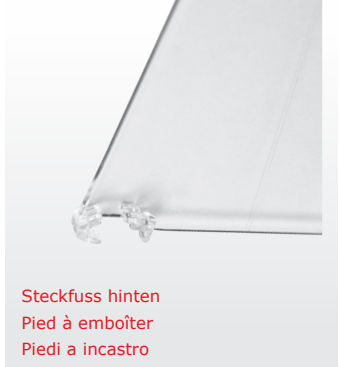
Steckfuss hinten Pied à emboîter Piedi a incastro