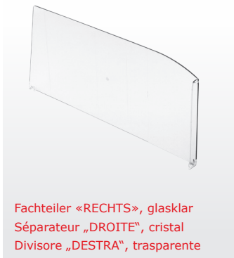
Fachteiler «RECHTS», glasklar Séparateur „DROITE“, cristal Divisore „DESTRA“, trasparente