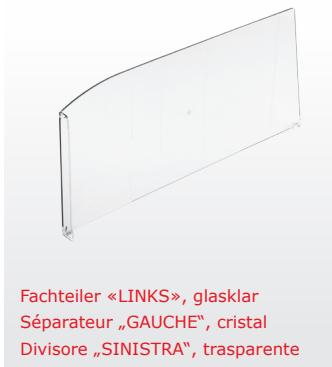
Fachteiler «LINKS», glasklar Séparateur „GAUCHE“, cristal Divisore „SINISTRA“, trasparente